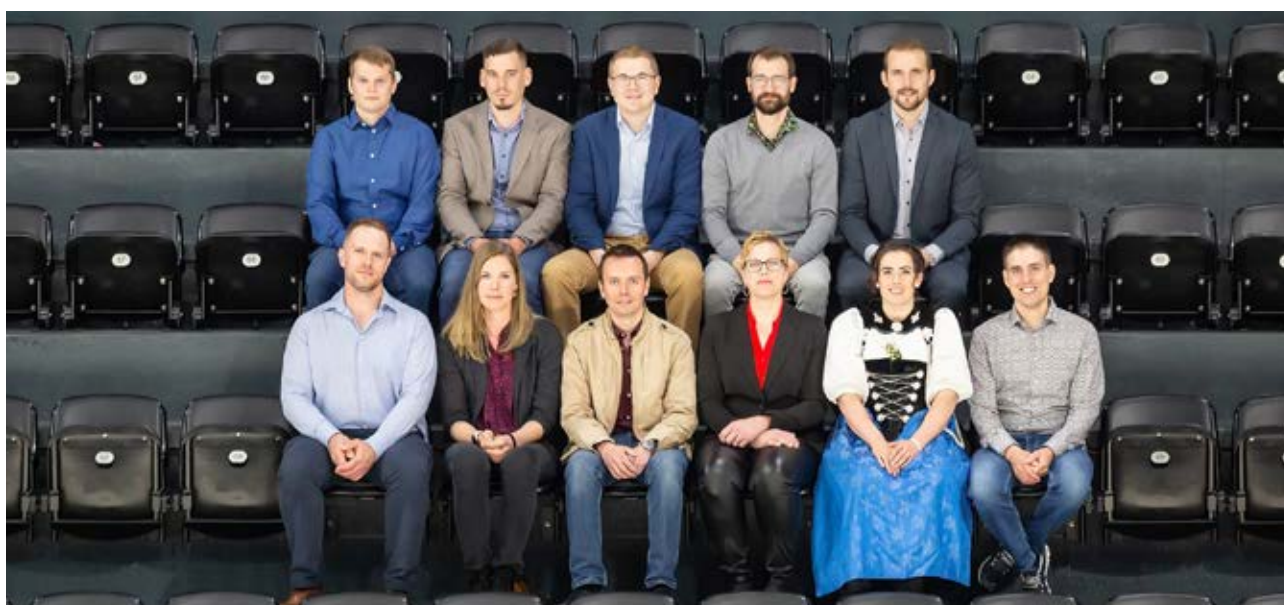
Die Diplomanden der Berufsprüfung und der höheren Fachprüfung anlässlich der Diplomfeier vom 6. Mai 2022.